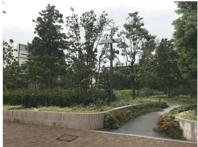
草本から低木の管理については、刈過ぎず、放置しすぎず、生息動物にとって良好な環境になるよう上手に管理されている。