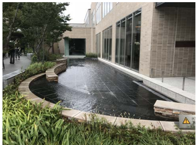
水が流れる流路のほか、止水部分も存在し、水域の保全だけでも多様な空間が創出される配慮されている。