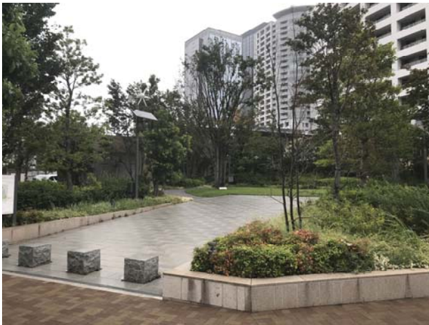
高木・中木・低木・草本が配置され、鳥類や昆虫類の良好な生息空間として機能している。

「ザ・パークハウス西新宿タワー60」は、東京メトロ丸ノ内線の西新宿駅から徒歩9分、都営大江戸線の西新宿五丁目から徒歩7分の都心の好立地に位置しており、周囲は再開発が進んでいますが、近隣には新宿中央公園や新宿御苑といった都内有数の規模を誇る緑地が存在しています。60階建ての高層レジデンスとなっている当施設の敷地内には、周辺緑地との緑のネットワークに配慮した約1,900㎡の公開緑地「結の森」が設けられ、10mを越える高木や中・低木層、そして草本層がバランス良く配置・管理されています。また、敷地内には、循環型の水辺が造られて水生植物も保全されており、これらの環境を好む鳥類や昆虫類といった生き物の良い生息空間となっています。また、当施設では、入居された住民の方を中心とした敷地内での巣箱設置設置や、生き物観察会の実施など、ひとと生きものが共生する生活空間がつけられています。